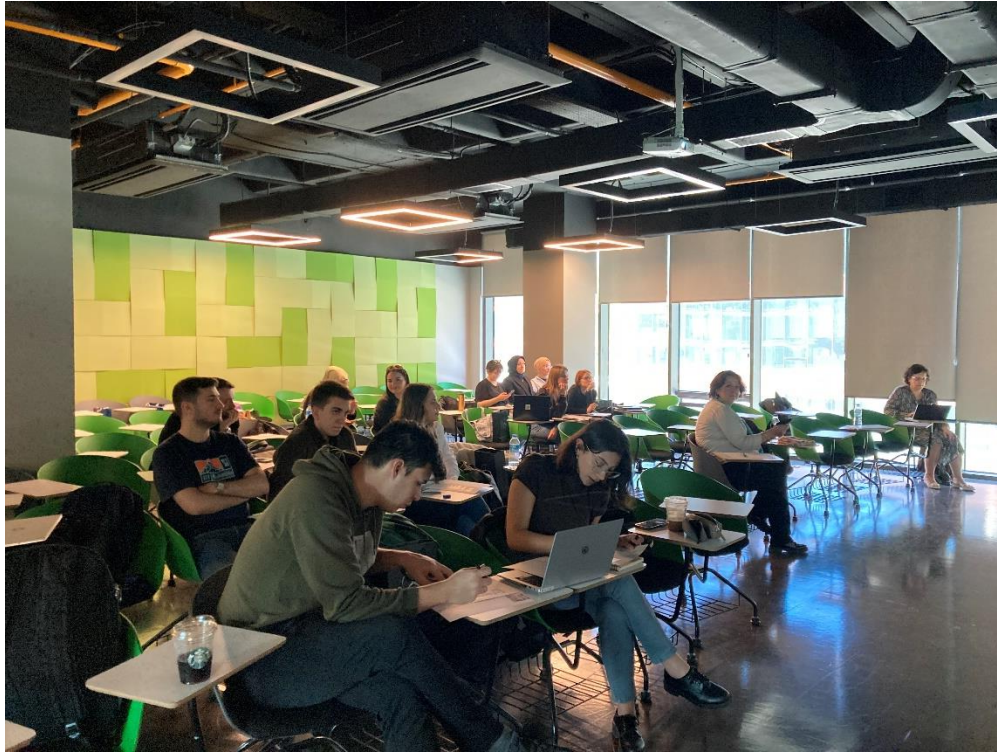
Erasmus hareketliliği kapsamında Portekiz Polytechnic Institute of Guarda Üniversitesinden gelecek üniversitemizi ziyaret eden hocaların öğrencilerimizle yaptığı çalışmalardan görüntüler.