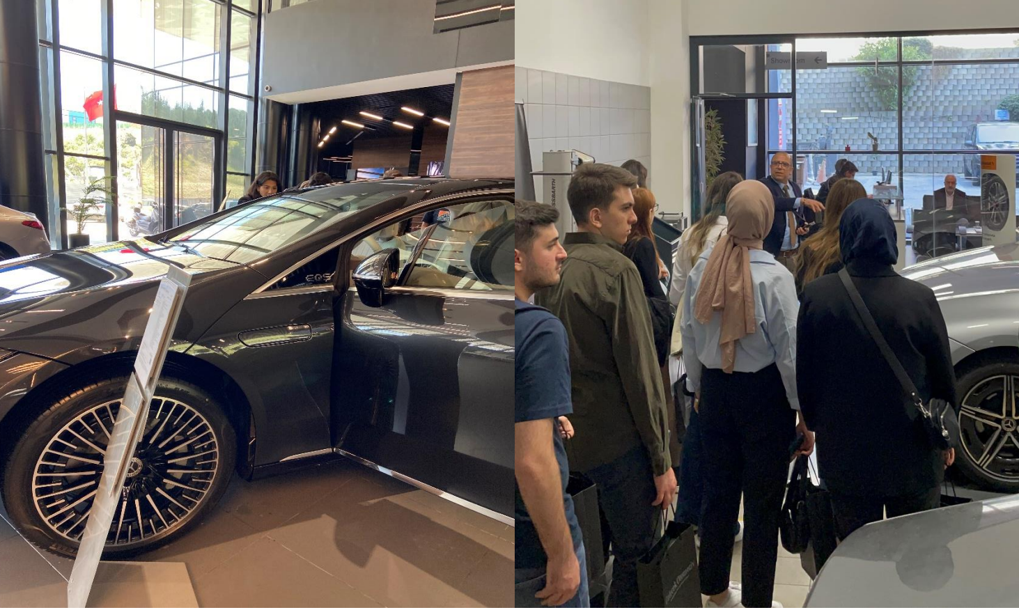
İstinye Üniversitesi Otomotiv Ekonomisi dersi öğrencileri “ Üniversite Sektörde ” kapsamında Otomotiv bayi ziyaretini gerçekleştirdiler.