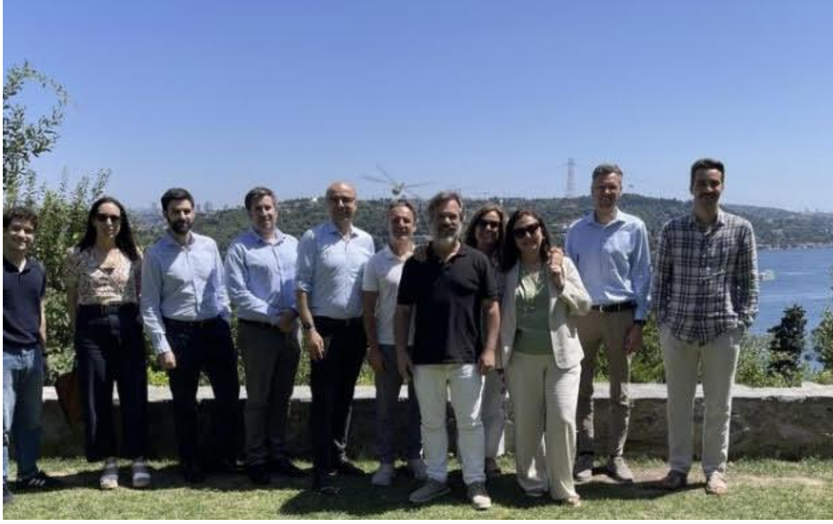
Sempozyuma katılan konuklar, Boğaziçi Üniversitesinde toplu halde.