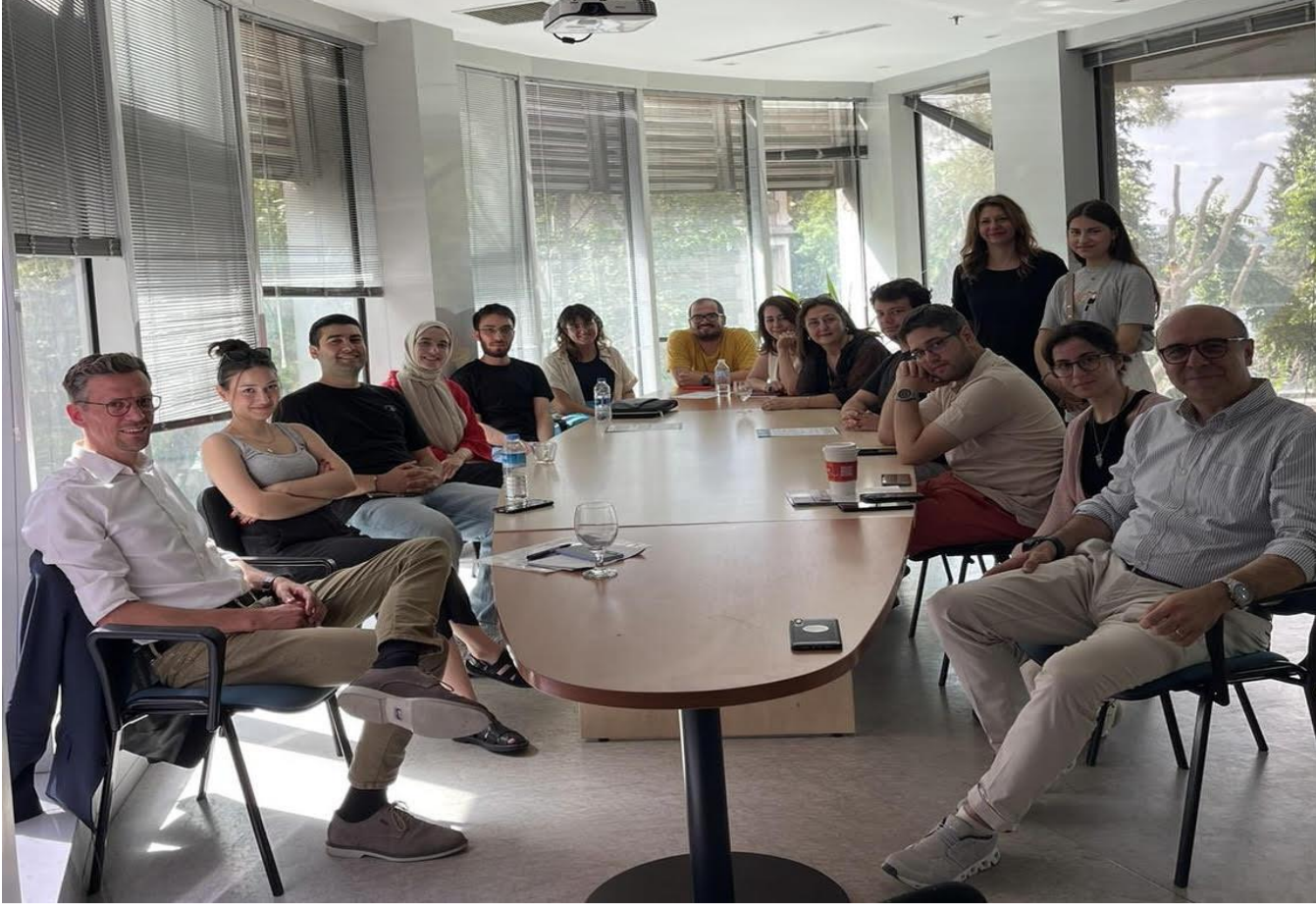
OECD Kariyer toplantısına katılan öğrenciler ve öğretim üyeleri bir arada.